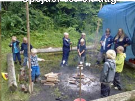
Spejder for en dag