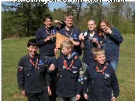
Kronhjorte vinder divi